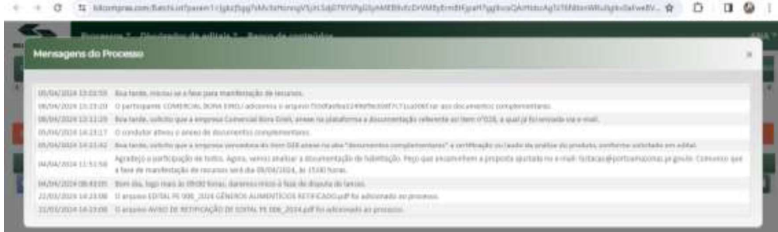
Imagem disponibilizada ao final deste documento para melhor visualização.

No caso da documentação apresentada, houve violação norma legal vigente, e, conforme descrito no instrumento convocatório, em especial ao item “9.28. A negociação será realizada por meio do sistema, podendo ser acompanhada pelos demais licitantes” , o que pode ser comprovado através das mensagens via chat no sistema, segue: